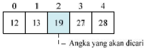
Gambar 1.1 Data Pencarian Sekuensial

Misalkan, dari data diatas angka yang akan dicari adalah angka 19 dalam array A, maka proses yang akan terjadi pada proses pencarian adalah sebagai berikut.